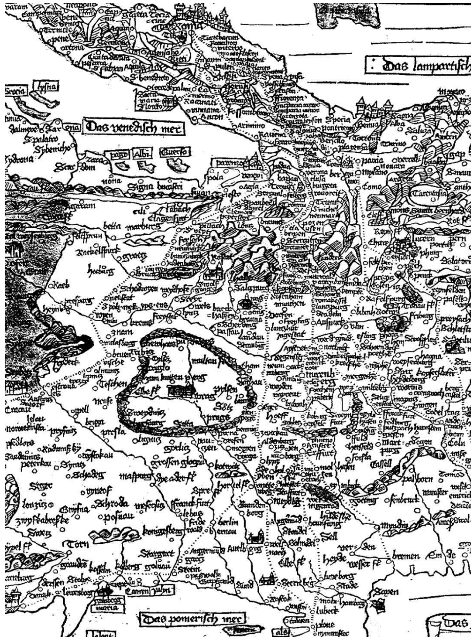
„Das ist der Rom-Weg...“, skala ok. 1: 5 300 000 (Fragment mapy w zmniejszeniu).