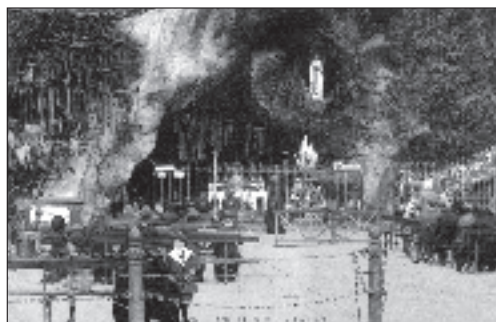
Fot. 1. Grota Masabielle – serce Lourdes (ok. 1910 r.)