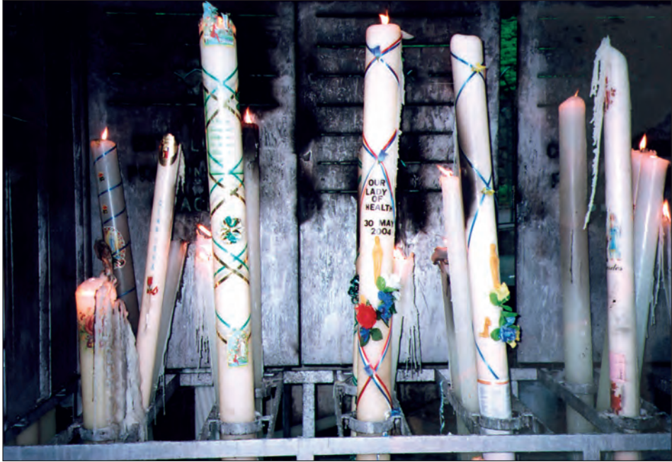
Fot. 6. Świece wotywnie w pobliżu Groty Masabielle