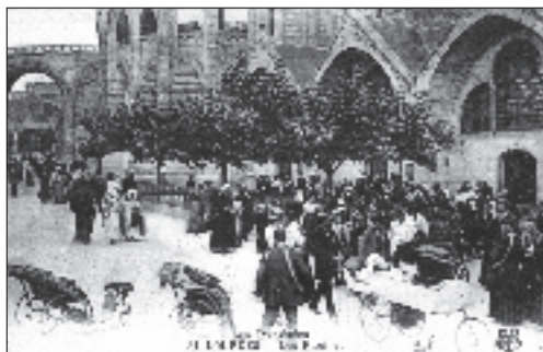
Fot. 2. Chorzy pielgrzymi w sanktuarium (1929 r.)