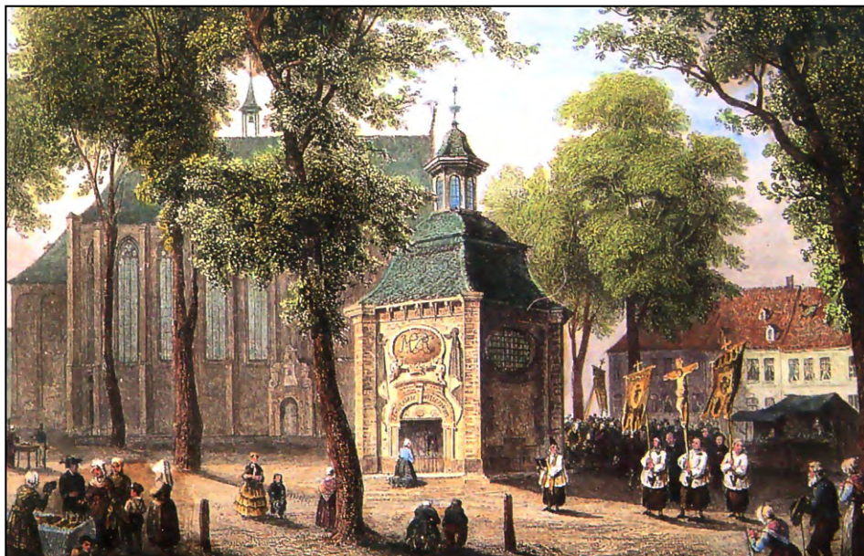
Kaplica Łask i Kaplica Świec w Kevelaer