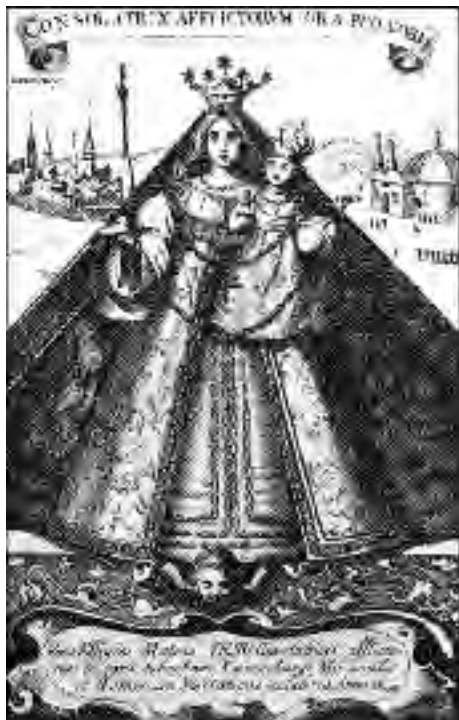
Cudowny wizerunek Matki Bożej Pocieszycielki Strapionych w Kevelaer