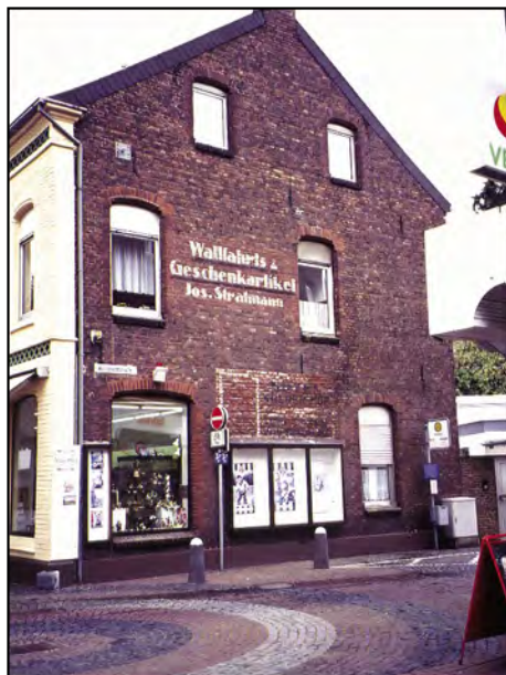
Sklep z pamiątkami religijnymi w Kevelaer