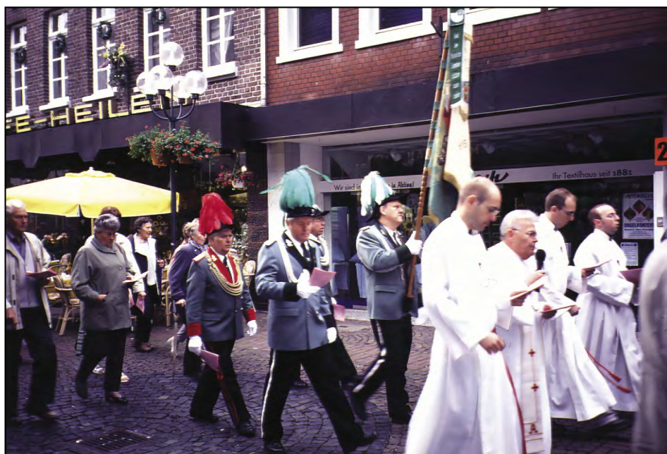
Pielgrzymi w procesji do sanktuarium Matki Bożej w Kevelaer