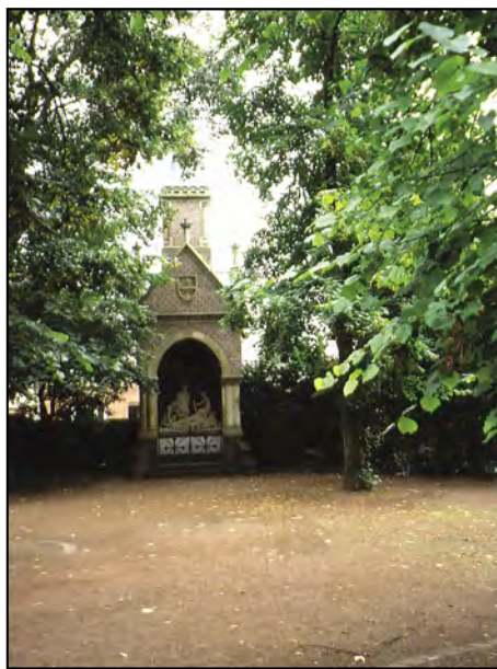
Kaplica 11. stacji drogi krzyżowej w Kevelaer