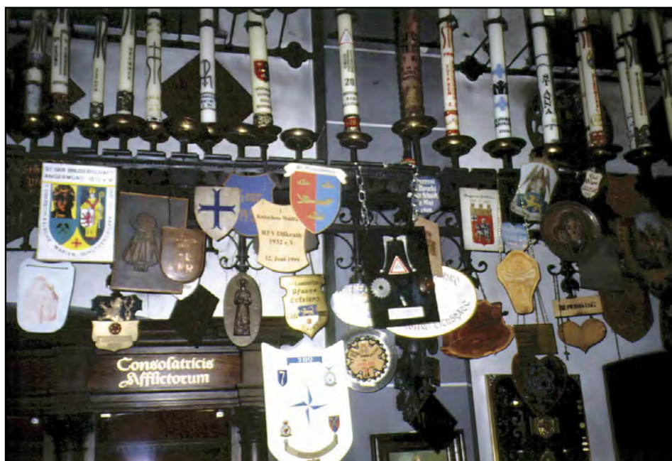
Wotywny świece i ryngrafy pielgrzymie w Kaplicy Świec w Kevelaer