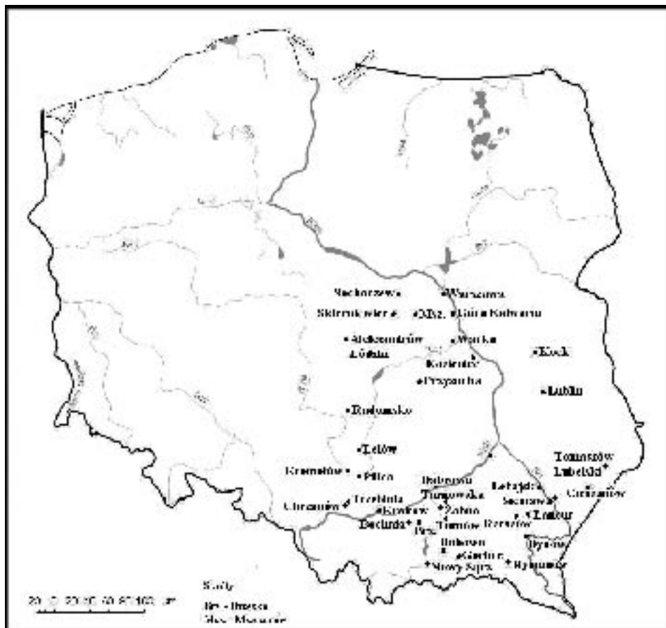
Ryc. 2. Miejscowości w Polsce, w których znajdują się ohele cadyków

Źródło: opracowanie własne na podstawie Żydzi w Polsce. Dzieje i kultura. Leksykon, op. cit., s. 69.