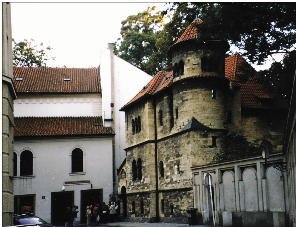
Praga – synagoga Klausova (na wprost) i budynek Żydowskiego Bractwa Pogrzebowego (po prawej)