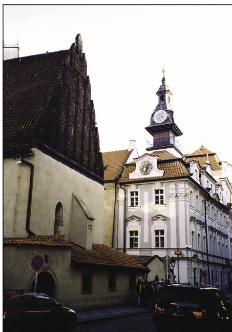
Synagoga Staronowa (po lewej) i Ratusz Żydowski