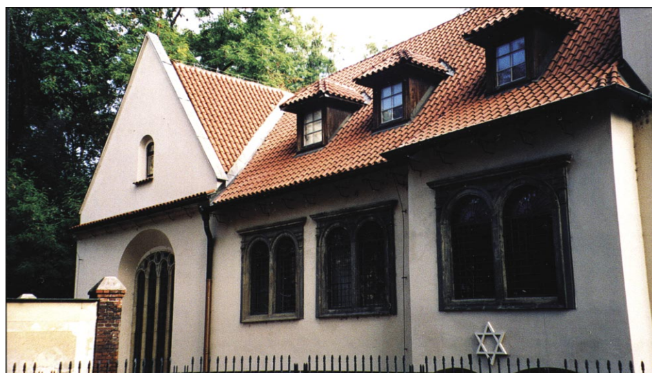
Synagoga Pinkasa w Pradze