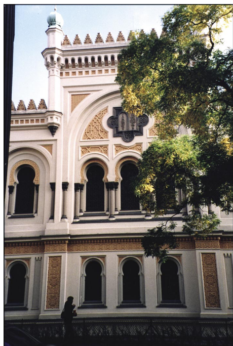
Synagoga Hiszpańska