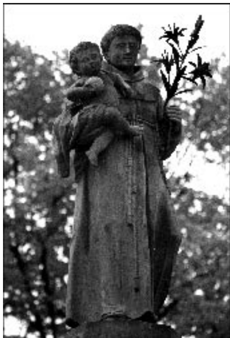
Figura św. Antoniego Padewskiego w Kalwarii Zebrzydowskiej

wał i redagował Kazania niedzielne oraz Kazania świąteczne, którymi pozyskał sobie niemal wszystkich mieszkańców Padwy, łącznie z miejscowym biskupem i duchowieństwem. Przybywały na nie tysiące słuchaczy, także spoza miasta. Wielu nawracało się i umacniało w wierze.