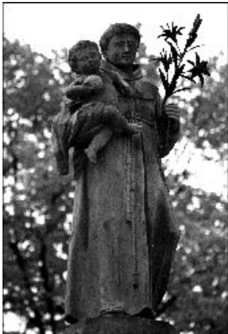
Figura św. Antoniego Padewskiego w Kalwarii Zebrzydowskiej

wał i redagował Kazania niedzielne oraz Kazania świąteczne, którymi pozyskał sobie niemal wszystkich mieszkańców Padwy, łącznie z miejscowym biskupem i duchowieństwem. Przybywały na nie tysiące słuchaczy, także spoza miasta. Wielu nawracało się i umacniało w wierze.