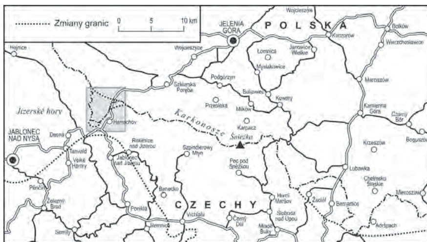
Ryc. 2. Stabilność i zmienność granicy politycznej w Karkonoszach w okresie X–XXI w.

ją przekraczać w dowolnym miejscu. Zachowano jednak zakaz jej przekraczania w Karkonoszach na obszarze Karkonoskiego Parku Narodowego oraz w rezerwacie doliny rzeki Izery. Całościowy przegląd dziejów granicy karkonoskiej przedstawiono w tab. 1, a jej zmienność na ryc. 2.