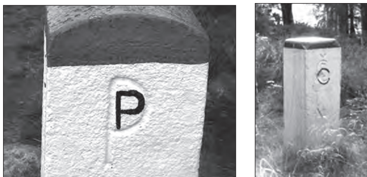
Fot. 1. Słupki graniczne na granicy polsko-czeskiej w Karkonoszach