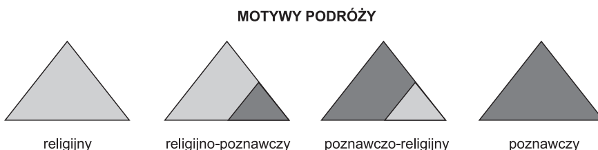
Ryc. 1. Motywy podróży do miejsc świętych