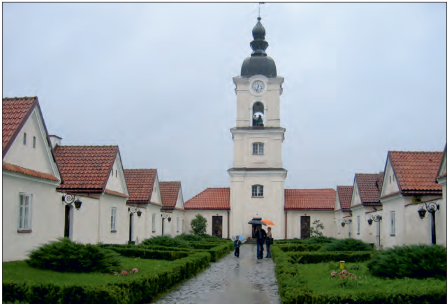
Fot. 4. Eremy w pokamedulskim klasztorze w Wigrach