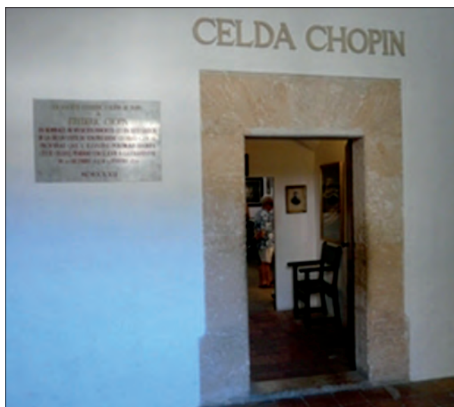
Fot. 2. Klasztor kartuzów w Valdemosie – cela Chopina