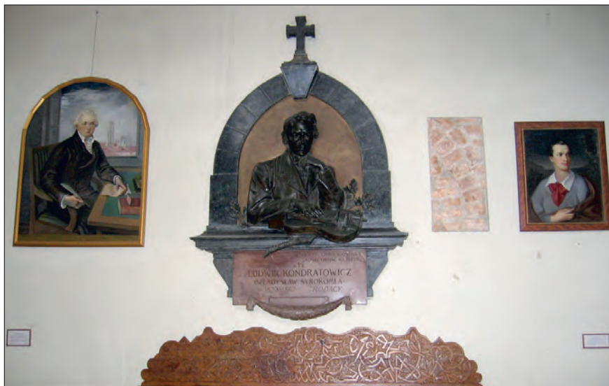
Fot. 1. Kościół Świętych Janów w Wilnie