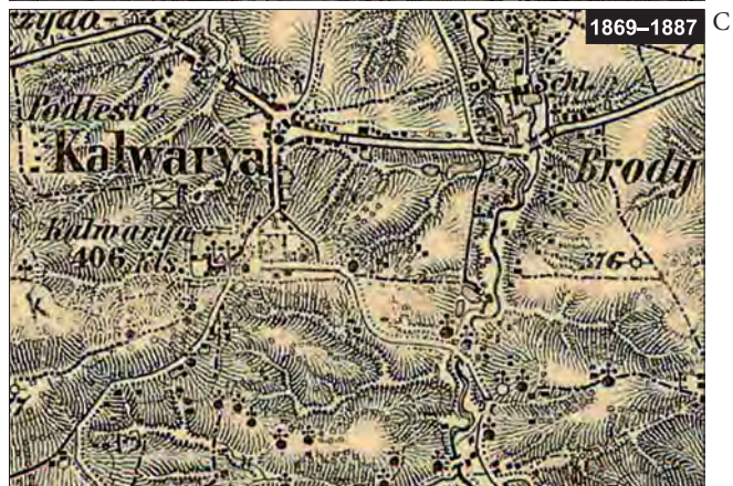
Ryc. 1. Sanktuarium w Kalwarii Zebrzydowskiej na historycznych mapach austriackich