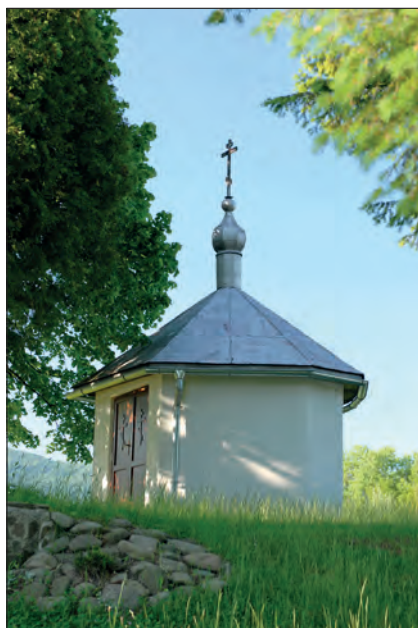
Fot. 2. Ulickie Krive (Słowacja) – naziemna kapliczka domkowa