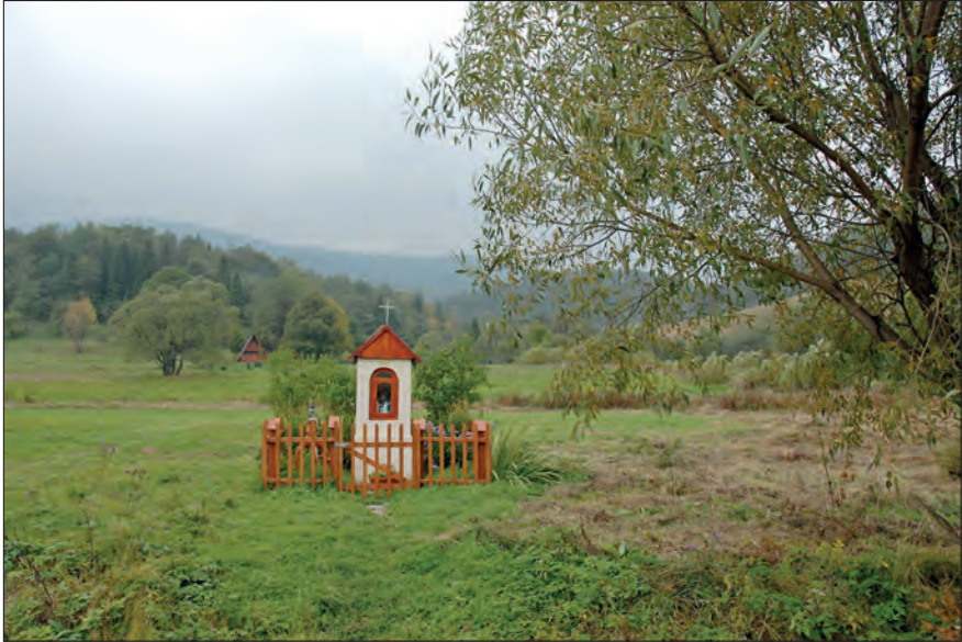
Fot. 5. Liszna (Polska) – kapliczka wnątkowa