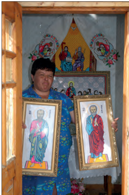
Fot. 4. Jabłonka Wyżna (Ukraina) – wnętrze kapliczki domkowej pw. św. św. Piotra i Pawła, z fundatorką