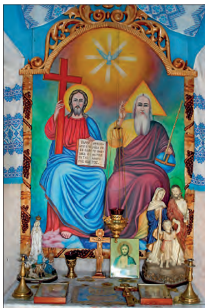
Fot. 3. Jabłonka Wyżna (Ukraina) – wnętrze kapliczki domkowej pw. św. Trójcy