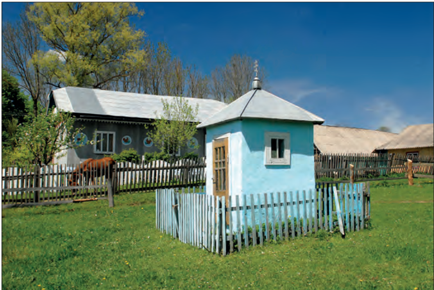
Fot. 6. Jabłonka Wyzna (Ukraina) – kapliczka naziemna domkowa