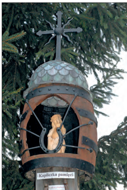
Fot. 1. Cisna (Polska) – zwieńczenie Kapliczki Pamięci