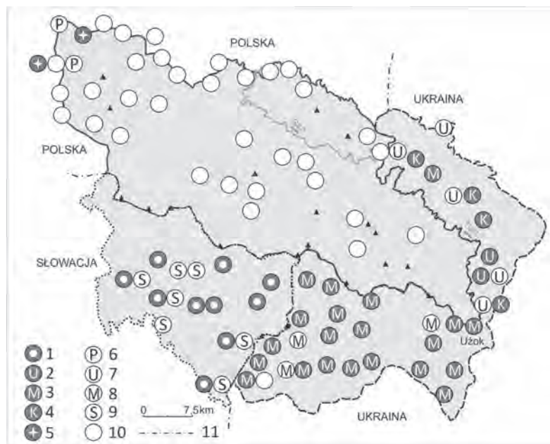
Ryc. 1. Rozmieszczenie świątyń wyznań chrześcijańskich

Objaśnienia: 1 – Autokefaliczna Cerkiew Prawosławna Krain Czeskich i Słowacji; 2 – Ukraiński Autokefaliczny Kościół Prawosławny; 3 – Cerkiew Prawosławna Moskiewskiego Patriarchatu; 4 – Cerkiew Prawosławna Kijowskiego Patriarchatu; 5 – Polski Autokefaliczny Kościół Prawosławny; 6 – Kościół Bizantyjsko-Ukraiński; 7 – Ukraiński Kościół Grekokatolicki; 8 – Autonomiczna Mukaczewska Eparchia grekokatolicka; 9 – Słowacki Kościół Grekokatolicki; 10 – Kościół Rzymskokatolicki; 11 – granica państwa.