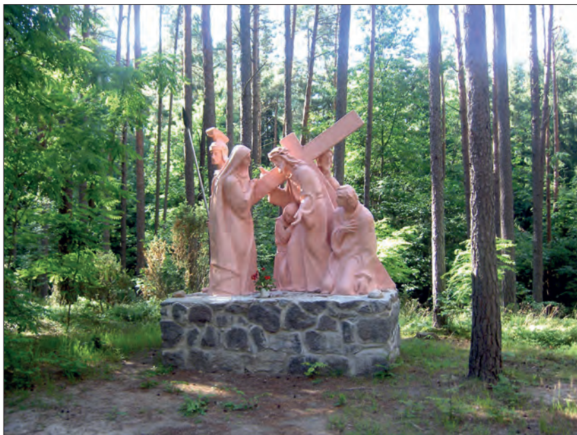
Fot. 1. Stacja IV Pan Jezus spotyka Matkę swoją