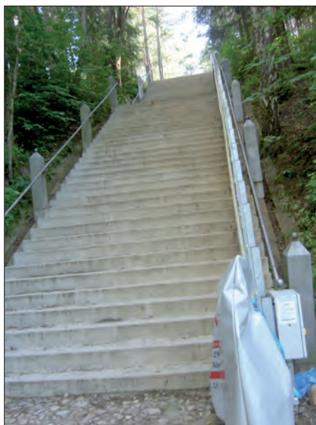
Fot. 4. Święte Schody