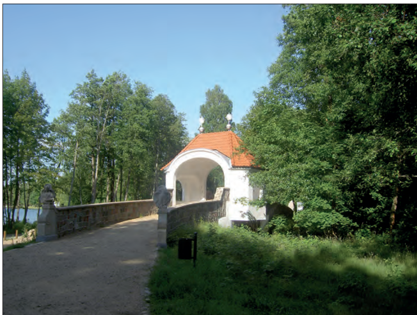
Fot. 2. Kaplica nad Cedronem