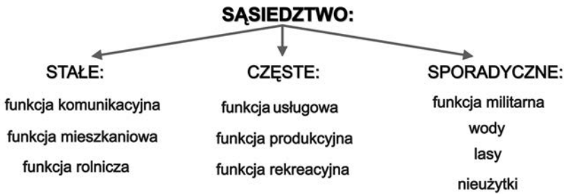
Ryc. 1. Schemat trwałości związków sąsiedztwa funkcji i kategorii