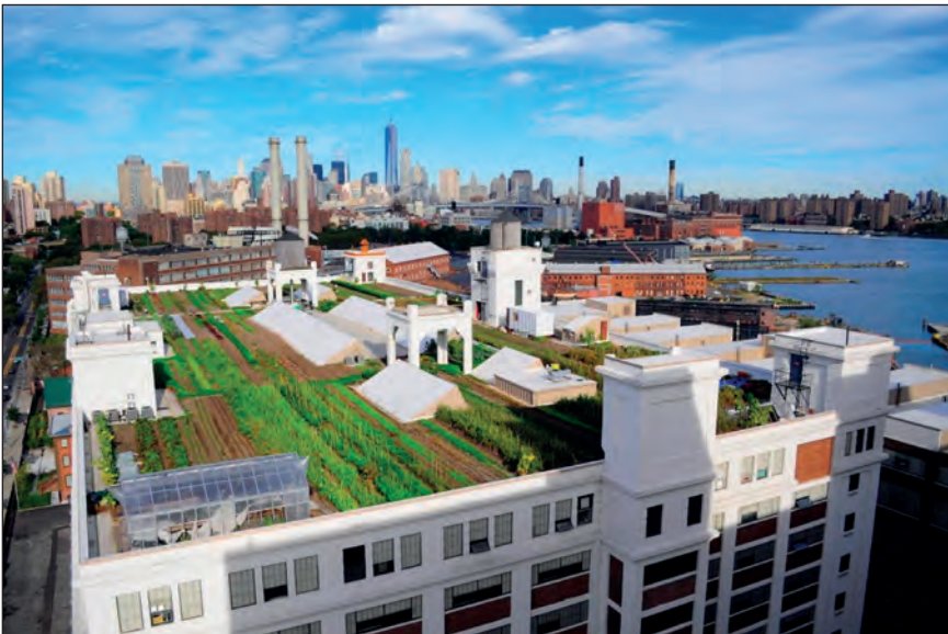
Fot. 2. Brooklyn Grange Farm w Nowym Jorku