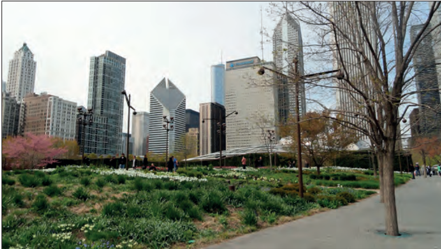
Fot. 1. Millenium Park w Chicago