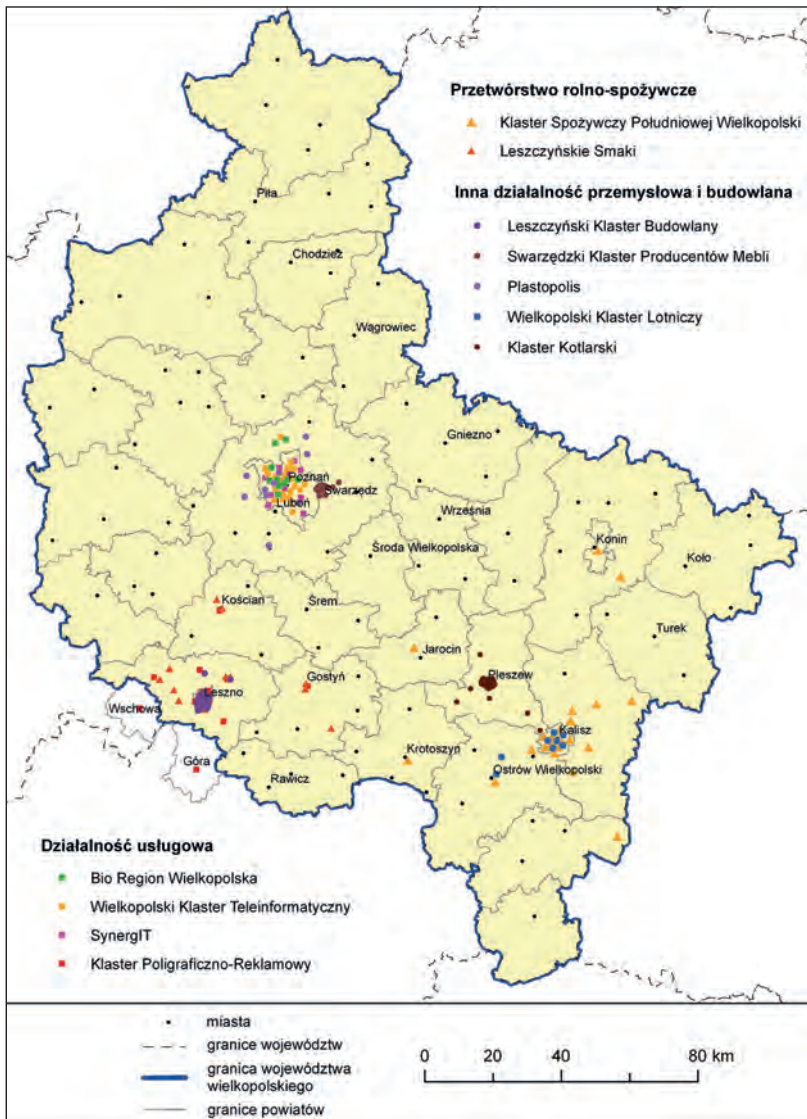
Ryc. 2. Rozmieszczenie i zasięg przestrzenny przedsiębiorstw wchodzących w skład najaktywniejszych organizacji klastrowych w województwie wielkopolskim