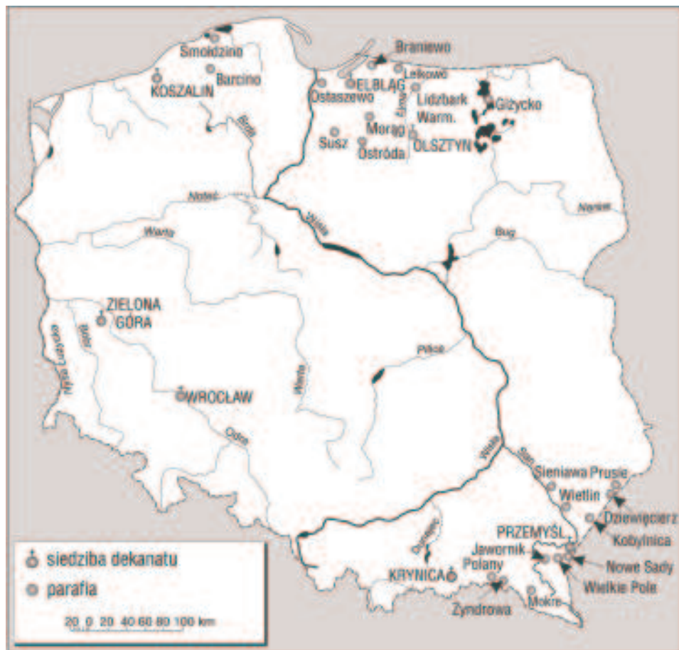
Ryc. 5. Nowe dekanaty wraz z parafiami erygowanymi w latach 1990-1994

Źródło: Szematyzm Vizantijskokukrainskoho duchowenstva u Polsci , w: Kalendar „Błahovista” 1995 , Górowo Iławeckie 1994, s. 150-159