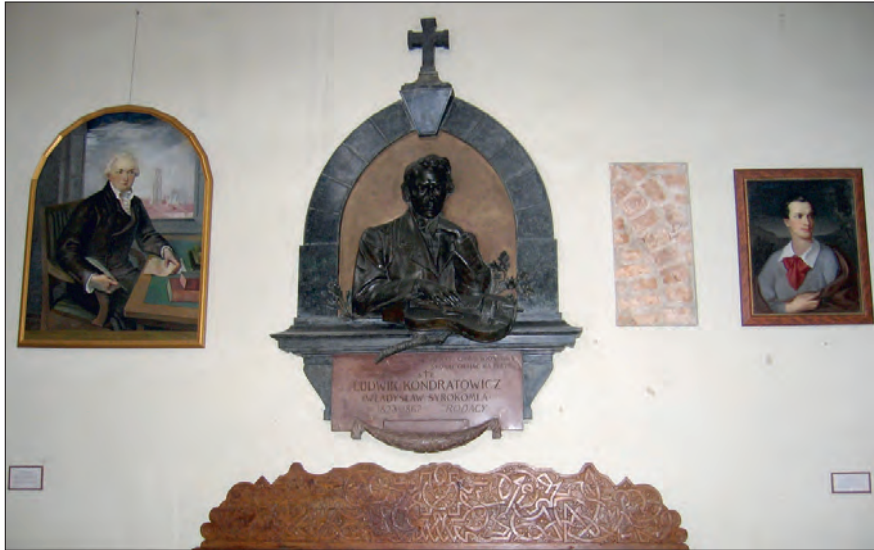
Fot. 1. Kościół Świętych Janów w Wilnie