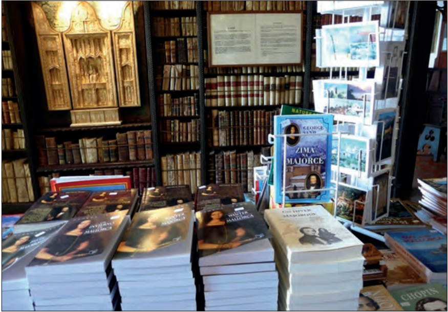
Fot. 3. Klasztor kartuzów w Valdemossie – sklep