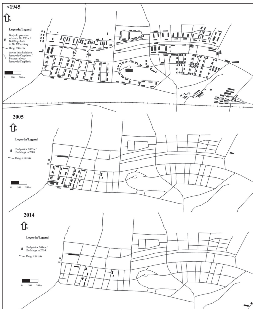
Ryc. 3. Przekształcenia zabudowy Kłomina w okresie od lat 30. XX w. do chwili obecnej